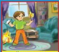
Неосторожное обращение с огнем