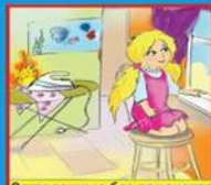
Оставленные без присмотра электроприборы