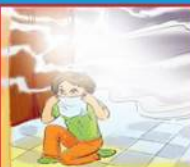
В задымленном помещении дышать через мокрую ткань