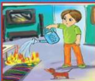
Мелкое возгорание потушить подручными средствами