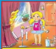
Игры с огнем