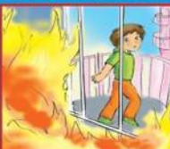
Если выйти невозможно, найти источник свежего воздуха, выбраться на балкон