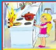
Газовые и электроплиты