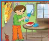
Вызвать пожарных по телефону 112