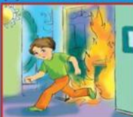
Если потушить невозможно, срочно покинуть помещение