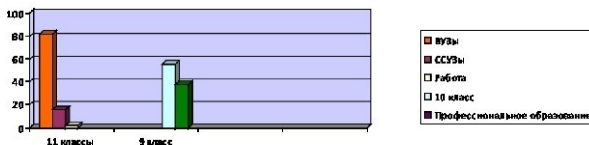
Диаграмма 2 Распределение выпускников

Наиболее популярным у выпускников является профессия юриста, инженерами различных специальностей будут 10 человек. Экономическую безопасность и программирование выбрали 5 выпускников, экономику - 3 выпускника. Специальность эколог, журналиста, дизайнера, связь с общественностью, правовое обеспечение национальной безопасности выбрали по 2 человека.